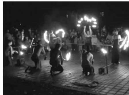
Lampionový průvod doplnila skvělá a dechberoucí ohňová show.

Tak co říkáte, přijdete příští rok s lampiony „na zasvěcenou“ i vy?