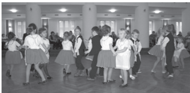
Folklorní soubor Sadováček zatančil našim babičkám a dědečkům.

Na zahradě školky jsme prožili odpoledne plné her a zábavy při Putování s dráčkem Mráčkem. Pohyb na čerstvém vzduchu si užily nejen děti, ale i jejich rodiče a sourozenci. A jaké vtipné úkoly děti plnily? Vozily řepu na kolečkách, sbíraly a nalepovaly listy na namalovaný strom, házely bramborami, také se svezly s papírovým drakem