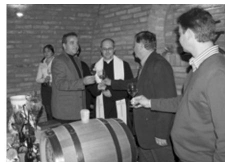
První přípitek mladým posvěceným vínem ročníku 2015.

Poděkování za uspořádání této pěkné vinařské slavnosti patří všem vinařům, kteří poskytli vzorky vín, panu faráři za jejich vysvěcení, Presúznímu sboru a cimbálové muzice Lašár za sváteční náladu a v nepo-