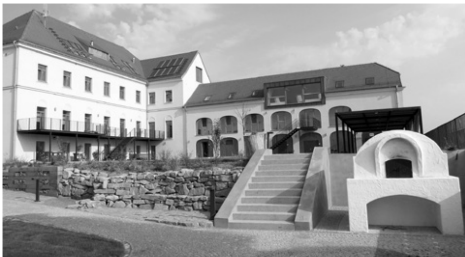
Ekocentrum Trkmanka je vskutku „živý organismus“, ani budova s okolím nestagnuje. Naopak, prochází neustálým vývojem. Tak třeba v létě přibyla na nádvoří pec na chleba.

* Průběžně aktualizujeme a doplňujeme nabídku vzdělávacích programů pro mateřské, základní a střední školy. Již nyní začínáme pracovat na nabídce pobytových a příměstských letních kurzů. Na začátek roku již máme připravenou tematickou výstavu, vyhlášení dalšího ročníku