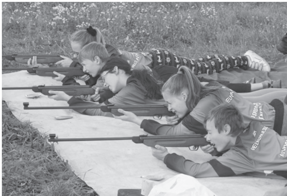
Mladí hasiči z Velkých Pavlovic na hře Plamen v Drnholci.