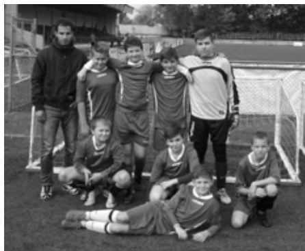
Minifotbalový tým mladších žáků – ZŠ Velké Pavlovice.

V mladší kategorii se přihlásilo celkem šest škol, rozdělena byla do dvou skupin. V starší skupině A jsme svedli boj o postup do