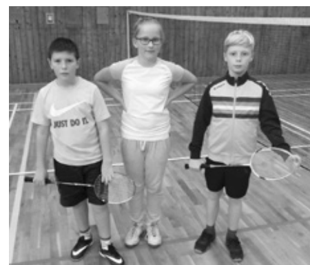
Stačí raketa, badmintonový míček, kvalitní obuv, tričko, kraťasy a hlavně pořádný kus sportovního ducha a touhy zvítězit... a můžete se pustit do badmintonu. Stejně jako naši malí borci!