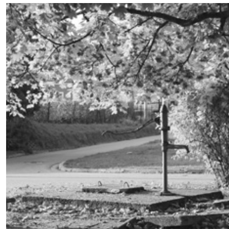
Sluncem prozářený, nezvykle teplý a teplotní rekordní... takový byl listopad roku 2015.