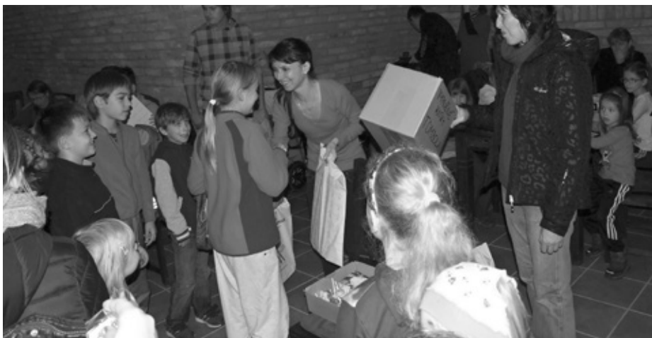
Hurááá, sladké odměny za vědomostní kvíz a losování tomboly.

Šlapka, ať už podzimní nebo jarní, má být záležitostí především pohodovou, nekomerční, přátelskou a byli bychom rádi, aby byla i rodinnou. A tak jsme se snažili nalákat hlavně děti, na hry, zábavný program, dobrodružství, tombolu, sladkosti, tvoření a tentokrát i vědomostní kvíz s názvem „Není lotr jako lotr aneb Znáš dobře své město?“. Děti odpověděly na pár jednoduchých otázek, v cíli ve Vinných sklepech Františka Lotrinského dostaly za účast cukrlata a pětadvacet vylosovaných šťastlivců pěkné věcné ceny z tomboly.