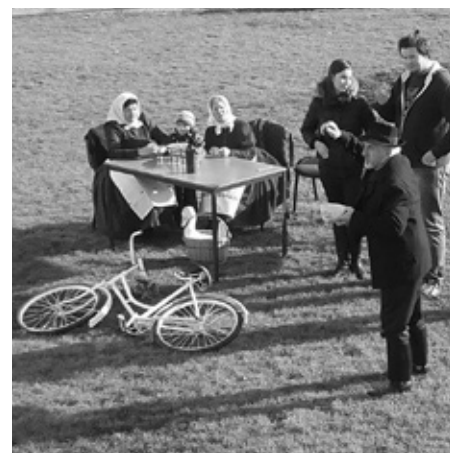
Dorazit však může i co by vyznavač cyklistiky, na bílém koly. Jako ten, který k nám na Svatomartinský jarmark dorazil ze sousedních Staroviček.

Stejně jako vloni zaměstnanci ekocentra pro návštěvníky přichystali pestré občerstvení. V nabídce bylo husí stehno s chle-