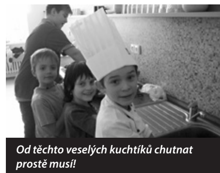
Od těchto veselých kuchtíků chutnat prostě musí!

Všem šla práce skvěle od ruky a palačinky zmizely pomalu dříve, než se je podařilo pro dokumentaci vyfotografovat.