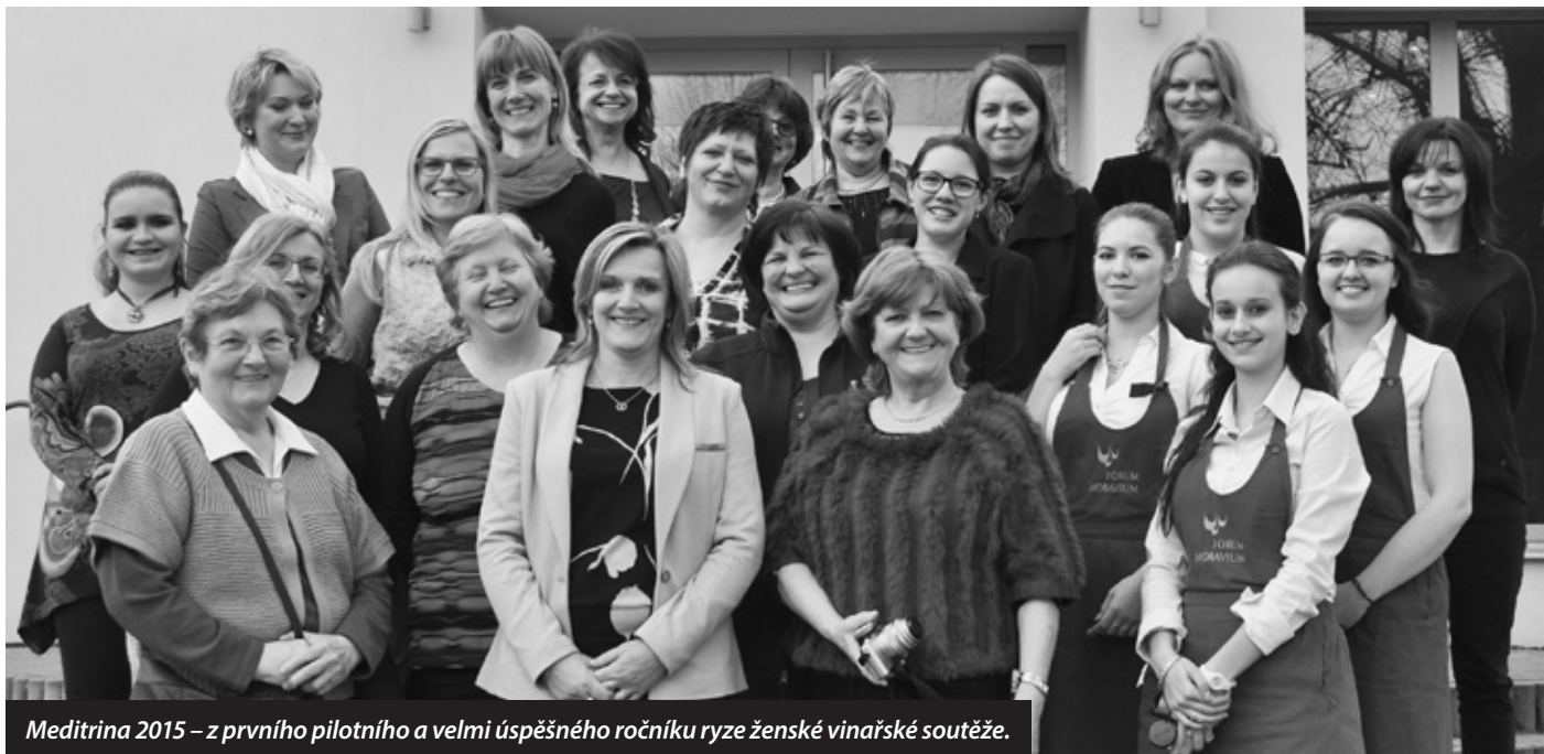
Meditrina 2015 – z prvního pilotního a velmi úspěšného ročníku ryze ženské vinařské soutěže.

Mezinárodní soutěž vín Meditrina vstupuje do svého druhého ročníku. Vína, hodnocená degustátorkami, se utkají 5. března 2016 ve Velkých Pavlovicích. Soutěž doprovází společenský večer.