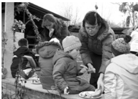
A jak chutnaly špekáčky křupkavé, voňavé? Jen se po nich zaprášilo.

a zároveň i rodinné akce „Rodina adoptuje svůj strom“. Rodiny, které zareagovaly na výzvu Města Velké Pavlovice a projevily zájem si společně se svými nejbližšími vysadit, adoptovat a také se nadále starat o svůj strom, si je za pomoci a asistence pracovníků Služeb města mohly vysadit právě v parčíku, který je prioritně určen aktivnímu vyplnění volného času pro celou rodinu. Cyklostezka, in-line stezka, dětské hřiště, herní prvky, pískoviště, skatepark a nově i pétanquové hřiště, co více si může rodina přát. Snad už jen ten svůj strom.