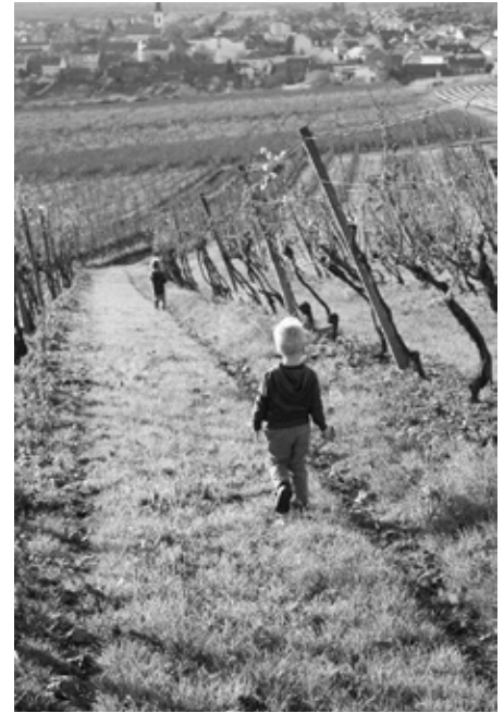
Z tvorby pana Oldřicha Otáhala „Listopadová neděle“.

Velmi rád bych pokračoval v započaté práci - ve sbírce starých fotografií. Obra-