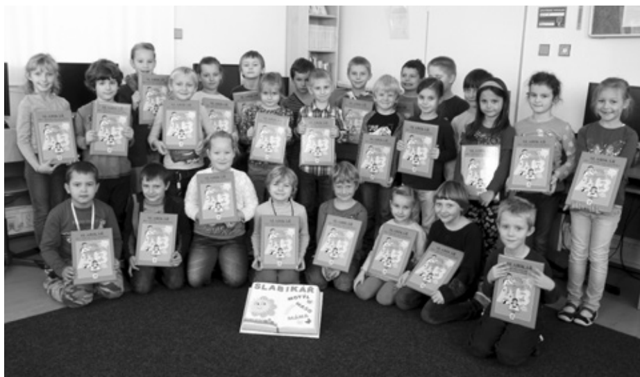
Slavný den pro prvňáčky, dostali Slabikář. Hurá do čtení!