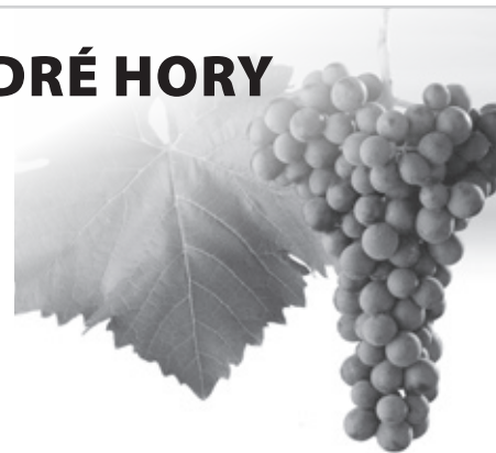
Odrůda révy vinné Modrý portugal.

původu a kvality jsou Frankovka, Svato-vavřínecké a Modrý Portugal. Z těchto je možné uvádět na trh červená vína po 18měsíčním zrání a mladá rosé vína.