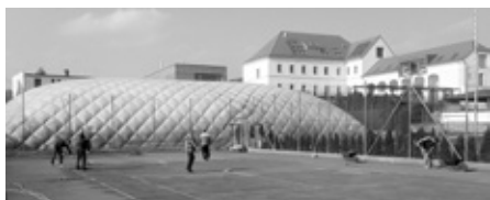
Končí říjen a s ním i tenisová sezóna roku 2015. Nastal čas pro brigádu, údržbu kurtů a jejich zazimování.

Letní část sezóny můžeme jistě hodnotit kladně. Z pohledu návštěvnosti kurtů dokonce nad očekávání. Vzhledem k tomu, že jsme poprvé využívali v létě pět kurtů, zvýšila se nejen návštěvnost, ale přišel i očekávaný