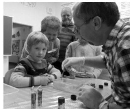
Den otevřených dveří se nesl ve znamení blížících se Vánoc, kdo měl ruce a nápady, tvořil o sto šest. A věřte nebo ne, výtvarniční se s notnou dávkou umu a nadšení nezřídka zhostili i páni kluci.

Atmosféra Dne otevřených dveří se nesla v duchu nadcházejících Vánoc. Celá škola byla vyzdobena vánočními stromečky a výtvarnými pracemi našich žáků. Při prohlídce školy si mohli nejmenší návštěvníci vyrobit v tvořivých dílničkách vlastní vánoční ozdoby z drátků a korálků, napsat přáníčko s motivem vánočního stromku či Mikuláše. Dětem a rodičům byla také nabídnuta možnost zhlédnout moderní způsob výuky na interaktivních tabulích, kterými jsou vybaveny všechny učebny školy.