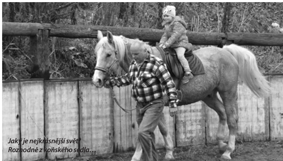
Jaký je nejkrásnější svět? Rozhodně z koňského sedla...

Ani cestou vstříc cíli, kopírující naučnou stezku Zastavení v kraji vína a meruněk, nebylo rozhodně kdy na nudu. Na ranči za cihelnou se tvořila dlouhá fronta netrpělivě čekajících dětiček na svezení na koni, druhá na střelbu z luku a třetí u stánku, kde byl k dostání čaj, pro dospělácký doprovod opět nezbytný svařák a pro všechny bez rozdílu věku špekáčky učené k vlastnoručnímu opečení nad plápolajícím ohněm. Hmmm... té vůně co se odtud linulo! V okamžiku, kdy lehce připálená kůrčička mastné uzeninky křupla mezi zuby, si nikdo ani nevzpomněl na poslední dobu tolik omílané zvěsti o rakovino tvorných uzeninách. U některých možná došlo i na ty pověstné „boule za ušima“.