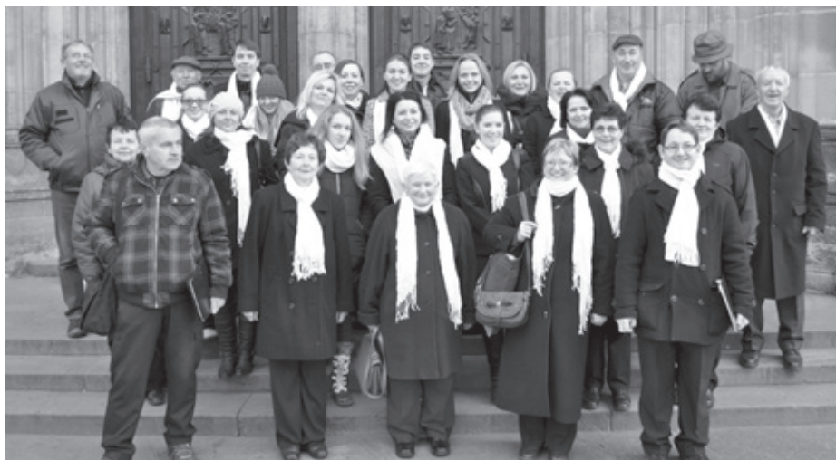
Chrámový pěvecký sbor LAUDAMUS v Praze. Jeho členové se stali součástí mnohasedlenného sboru zpívajícího pro charitu.

Vyrazíte-li na výlet do Prahy, většinou nevynecháváte Hradčany s Chrámem svatého Víta. Uvědomělý turista si však v němém úžasu nad velikostí této stavby nedovolí ani nahlas povzdechnout. Členům chrámového sboru se však dostalo příležitosti smět si vyzkoušet akustiku chrámové lodí a z plných plic a od srdce si zde zazpívat.