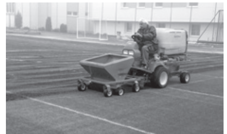
Pokládka nového umělého trávniku na stadionu za školami.

Sportovní areál v komplexu škol prošel během podzimních měsíců významnou rekonstrukcí. Bylo zde srovnáno podlaží a kompletně vyměněn umělý povrch. Nový povrch tzv. „třetí generace“ položila specializovaná firma JM Demicarr, s. r. o. prioritně se zabývající výstavbou sportovišť. Tento umělý trávník je vyvinutý speciálně pro fotbal a malou kopanou. Pohyb po něm je velmi ohleduplný k pohybovému ústrojí hráčů. Hřiště tak již může plnohodnotně sloužit svému účelu a to hodinám tělesné výchovy žáků a studentů místních škol.