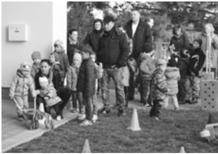
Na startu velká fronta a dychtivé očekávání zrcadlí se v očích dětí. Jaké to asi bude s Dráčkem Mráčkem?!

modelu, čas nezastavíš... Na dalším místě popadla sportovní drobotina namísto míčků brambory a házela je na panáka. Čtvrté stanoviště patřilo sjezdu skluzavky s dráčkem a poslední vyhrabávání šišek z písku.