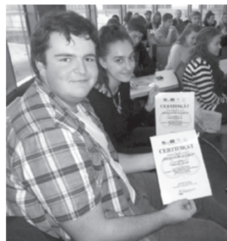
Studenti velkopavlovického gymnázia obdrželi na Mendelově univerzitě v Brně certifikáty o úspěšném absolvování projektu Propagace a popularizace výzkumu a vzdělávání v oblasti bioenergetiky.

Studenti velkopavlovického gymnázia se této certifikace a exkurze zúčastnili proto,