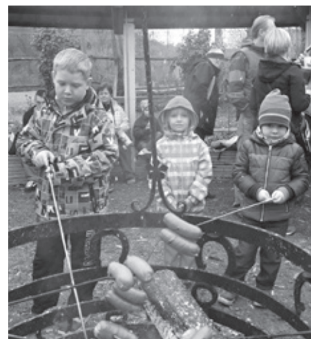
Opékání na pravém táboráčku, na ranči za cihelnou přišlo vhod.

Na stejném místě, tedy v parčíku u Trkmanky a ve stejném termínu, tedy o svátku 17. listopadu 2015, proběhlo v rámci Podzimní Šlapky další kolo veskrze ekologické