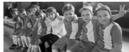
Stříbrná velkopavlovická přípravka na turnaji u slovenských sousedů v obci Šenkvice.

Pro nás nejdůležitějším zjištěním bylo, že kluci odmakali celý turnaj a předváděnou hrou potěšili nejenom nás trenéry, ale i sku-