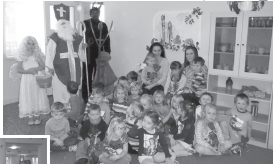
Školkařky přišel začátkem prosince pozdravit Mikuláš. Vzal sebou spanilého andílka a přidal se k nim i darebný čert!

Děti v MŠ zhlédly pohádku „O začarovaném princí“ a představení z divadla Bolka Polívky „Kuk a Cuk“. Při hudební pohádce „O Červené Karkulce“ se nejen pobavily, ale také poučily, jak se správně chovat.