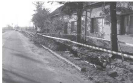
Ulice Nádražní – rekonstrukce vodovodu.

Zaměstnanci služeb města zahájili začátkem měsíce listopadu na ulici Nádražní generální opravu vodovodního řadu, která si vyžádala s tím spojené výkopové práce. Samotnou výměnu řadu provedla společnost VaK Břeclav, a.s.. V příštím roce proběhne plánovaná rekonstrukce chodníku.