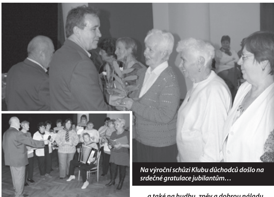
Na výroční schůzi Klubu důchodců došlo na srdečné gratulace jubilantům...

... a také na hudbu, zpěv a dobrou náladu.