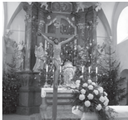
Vánoční svátky v kostele Nanebevzetí Panny Marie.