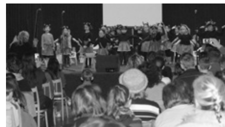
Úvod benefičního koncertu DĚTI DĚTEM patřil dětem z mateřské školy. Rozjely to přímo pekelně!