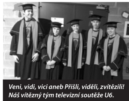
Veni, vidi, vici aneb Přišli, viděli, zvítězili! Náš vítězný tým televizní soutěže U6.

Naším protivníkem byla Základní Masarykova škola z Českého Těšína. Hned v úvodu se ujala vedení a to si držela po celou dobu. V předposlední soutěži, sportovní, se nám podařilo s přehledem vyhrát a tím jsme se vrátili zpátky do hry o celkové ví-