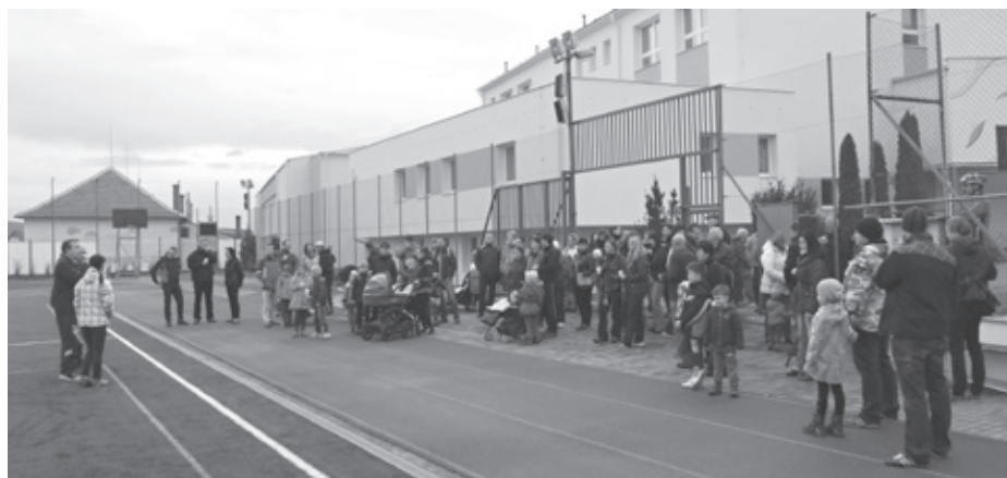
Podzimní Šlapka byla zahájena na sportovním stadionu.

Prošlápnout se městem a krajinou okolo Velkých Pavlovic vyrazili naprosto všichni – malí, velcí, jiní, stejní a dokonce i čtyřnozí!