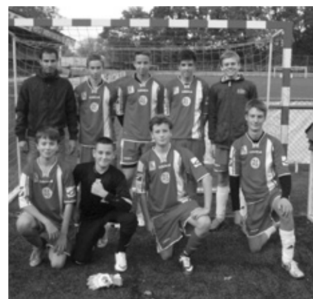
Minifotbalový tým starších žáků – ZŠ Velké Pavlovice.