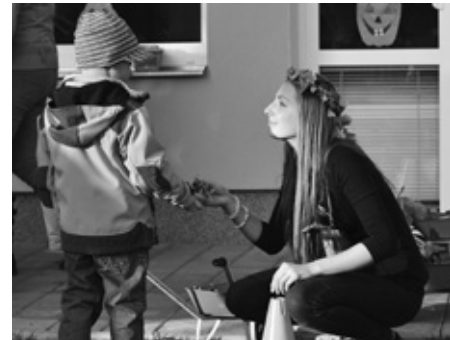
V cíli odměna, laskavý úsměv Podzimní víly a nakonec i zdravé mlsání.

Na zahradě bylo rušno, veselý výskot, švitoření a hlazol se rozléhal do dálky, sílu ztrácející podzimní sluníčko hrálo jak jen ke konci října dokáže, znaveno však v po-