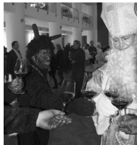
Letos se Promenáda konala v den obchůzky mikulášské družiny. A tak si mohli účastníci akce zcela mimořádně přituknout i se samotným Mikulášem, andělem a nebo s čertem.