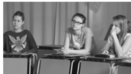
Studentky velkopavlovického gymnázia se zúčastnily osmého ročníku literární dílny v Brně.