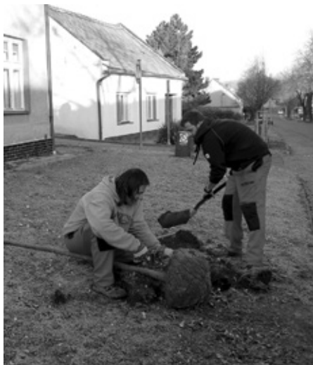
Příprava sazenic lip k výsadbě na ulici Hlavní.

nebo uhlím. Mnozí k topení využívají kotle na tuhá paliva nebo nejrůznější krby. A právě na ně apelujeme, aby k topení v žádném případě nepoužívali domovní odpad, dřevo se zbytky barev, gumu, plasty, popř. PET láhve. Při jejich hoření vznikají látky, které nejen zapáchají, ale také ničí zdraví nás všech!